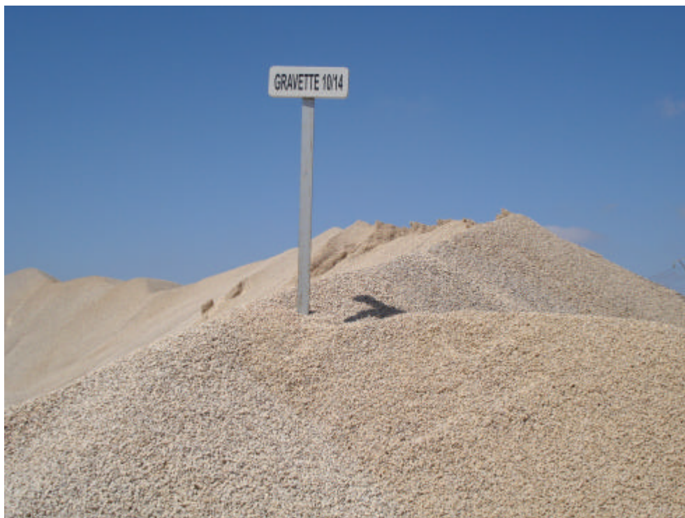
Photo n°1 : Carrière, lieu de prélèvement des échantillons pour LA et CA

Echantillons pour essais Los Angles et Coefficient d'aplatissements.