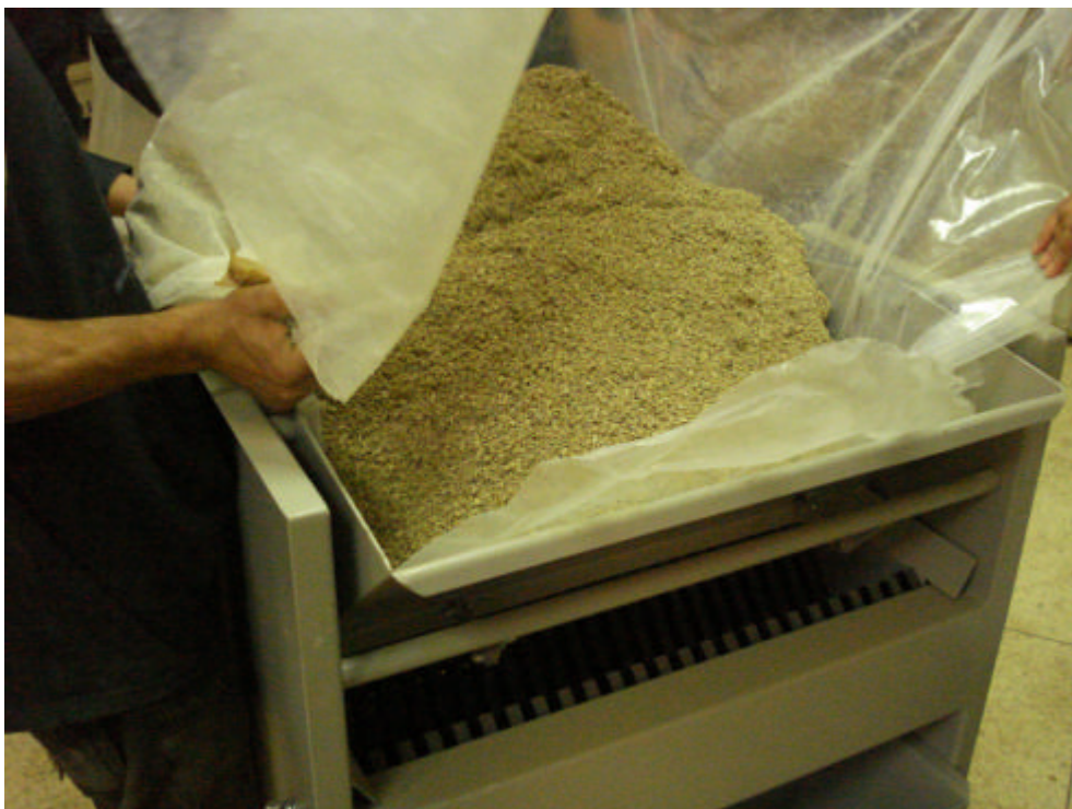
Photo 10 : Préparation échantillons par passage successive à l'échantillonneur à couloires